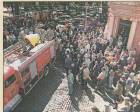
Cortejo: corpo em caminhão do Corpo de Bombeiros seguiu até o Cemitério das Irmandades, junto ao Hospital de Caridade e Beneficência