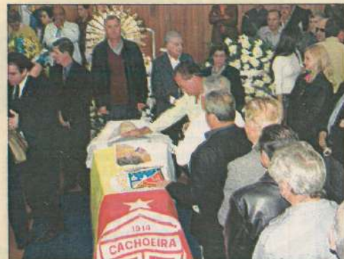
Despedida: fila de autoridades e populares mostrou a grande aceitação do homem público que dedicou grande parte da vida aos necessitados de Cachoeira