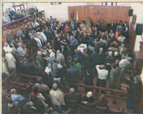
Multidão: milhares de pessoas passaram pelo Plenário Edgar Müller do Palácio Legislativo João Neves da Fontoura para dar o último adeus