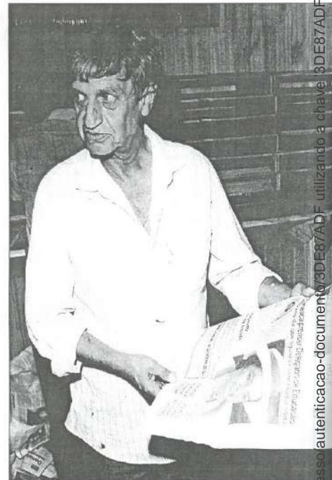
Com a edição histórica do Correio Popular

A fundação do Jornal O CORREIO foi uma das grandes realizações do empreendedor Pedro Germano. Na madrugada de 22 de março de 1992, saía da Empresa Jornalística Editora e Gráfica Progresso Ltda. a primeira edição do Correio Popular, denominada Número Zero (Edição Histórica). O início da contagem definitiva do jornal seria no dia 29 de março de 1992, mesmo dia do aniversário de Pedro Germano, um dos maiores líderes e um exemplo de trabalho e determinação.