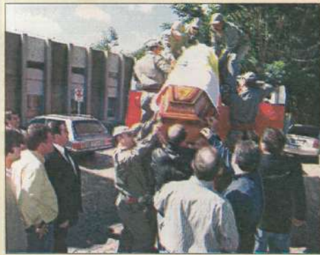
Chegada: familiares conduzem o corpo de Pedro Germano, grande líder político e empreendedor das comunicações, até ao Jazigo da Família, onde foi sepultado