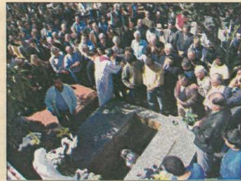
Encomendação: orações ajudaram a dar alento religioso para os familiares e em homenagem a quem durante toda a vida nunca esqueceu dos compromissos para com Deus e com a família